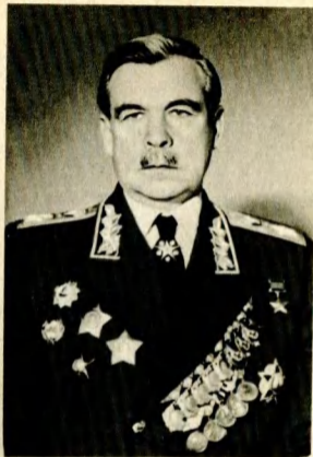
Маршал Советского Союза Л. А. Говоров

Сегодня предмет особого внимания Говорова — намерения противника в динамике операции. Он под-