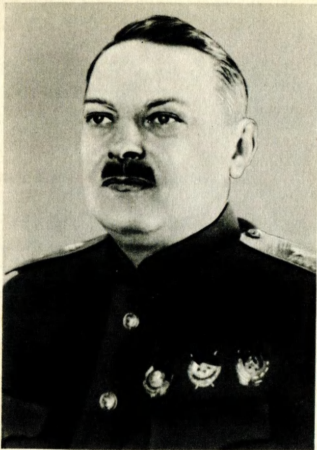
Первый секретарь Ленинградского обкома и горкома партии, член Военного совета Ленинградского фронта А. А. Жданов. 1943 г.