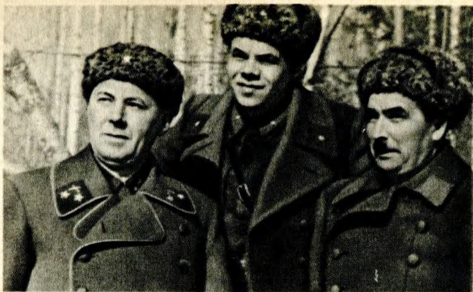
Слева направо: командующий 55-й армией генерал-майор артиллерии В. П. Свиридов, член Военного совета 54-й армии бригадный комиссар Д. И. Холостов, командующий 54-й армией генерал-майор И. И. Федюнинский. 1941 г.