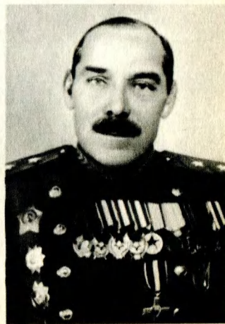
Командующий 67-й армией Ленинградского фронта генерал-лейтенант М. П. Духанов