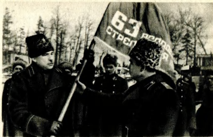
Генерал-полковник Л. А. Говоров вручает гвардейское знамя командиру 63-й гвардейской дивизии генералу Н. П. Симоняку после прорыва блокады. 1943 г.