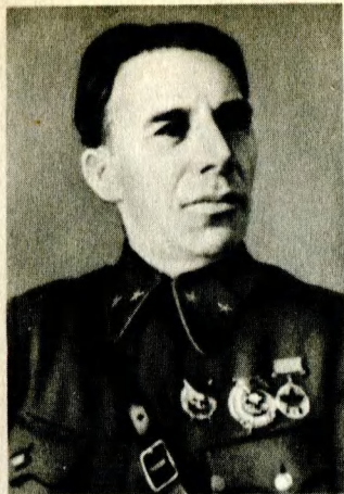
Командующий 42-й армией Ленинградского фронта генерал-майор И. Ф. Николаев. 1942 г.